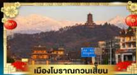
เมืองโบราณกวนเสียน