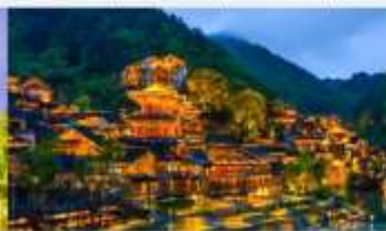
หมู่บ้านโบราณวูเจียงจ้าย