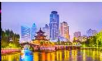
หอเจียเซียวไหลว