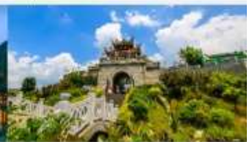
เมืองโบราณซิงเหยียน

*ทางบริษัทฯ ขอสงวนสิทธิ์ในการสลับโปรแกรมทัวร์ตามความเหมาะสมขึ้นอยู่กับสถานการณ์หน้างาน โดยคำนึงถึงผลประโยชน์ของลูกค้าเป็นสำคัญ