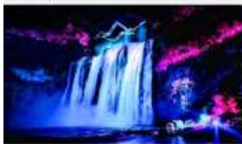
อุทยานน้ำตกหวงทิวซู่