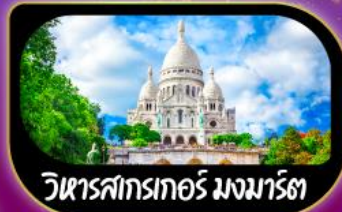
วิหารสกรเทอร์ มงมาร์ต