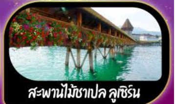
สะพานไม้ฆาปค ลูซิิร์น