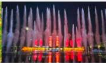
น้ำพุคังปาซือ