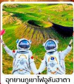
อุทยานภูเขาไฟอูลันฮาตา