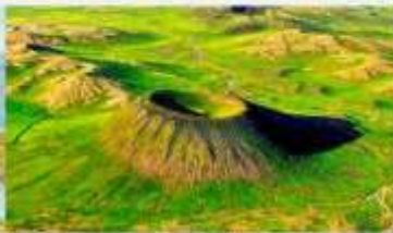
อุทยานภูเขาไฟอูลันฮาตา