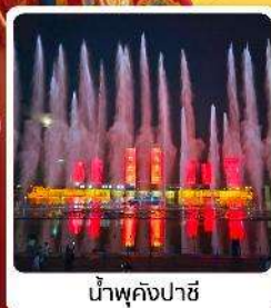
น้ำพุคังปาซี

● ไอลีก์ เป็นมรดกสายสีเขียวอัน แผลงท่องเที่ยวระดับ 5A ของจีน ภูเขาไฟอูลันฮาตา น้ำพุคังปาซี น้ำพุที่สูงที่สุดในเอเชีย