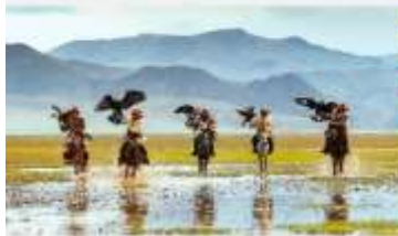
ชนเผ่ามองโกเลีย