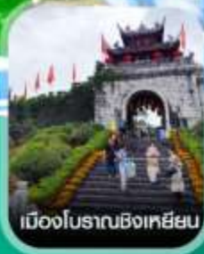
เมืองโบราณชิงเหยียน