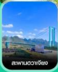
สะพานฮวาเจียง

✈️ คอนเฟิร์มออกเดินทาง ทุกพีเรียด 2 ท่านขึ้นไป