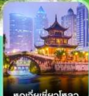
หอเจี่ยเซี่ยวโหลว