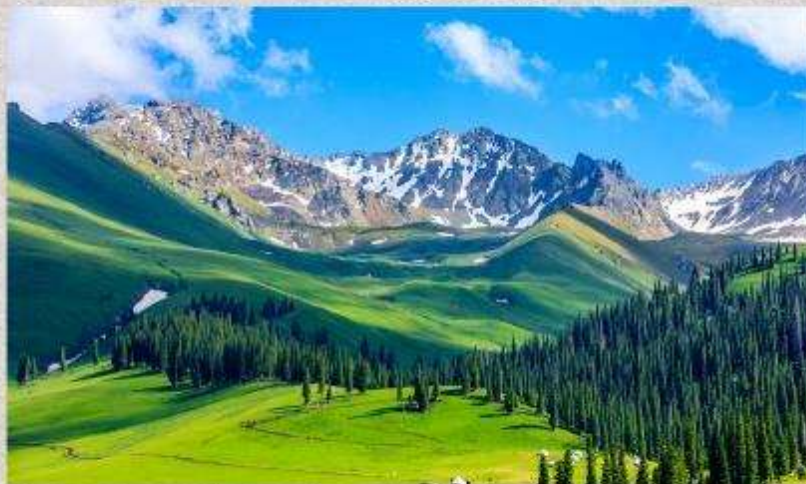
ทุ่งหญ้านาลากี