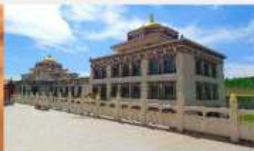
ทำเนียบพระลามะอุหลาน