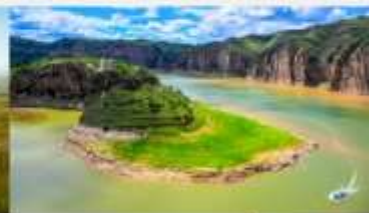
แกรนด์แคนยอนแม่น้ำเหลือง

*ทางบริษัทฯ ขอสงวนสิทธิ์ในการสลับโปรแกรมทัวร์ตามความเหมาะสมขึ้นอยู่กับสถานการณ์ทำงาน โดยคำนึงถึงผลประโยชน์ของลูกค้าเป็นสำคัญ