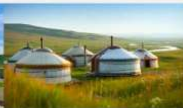
กุ่มหน้าออร์ดอส