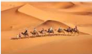
ชีจู้ชึมทะเลทราย