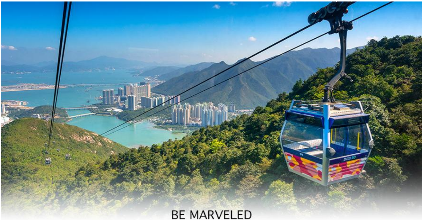
BE MARVELED กระเช้ามองปีง

ของอุทยานบนเกาะลันเตาเหนือ ถือได้ว่าเป็นแหล่งท่องเที่ยวอันมีเอกลักษณ์ระดับโลกของฮ่องกง (**กรณี กระเช้ามองปีง 360 มีการปิดซ่อมบำรุง หรือ มีการปิดเนื่องจากสภาพอากาศแปรปรวน ทางบริษัทฯ ขอสงวน สิทธิ์ในการเปลี่ยนเป็นใช้รถโค้ชของทางอุทยานในการเดินทาง เพื่อนำท่านขึ้นสู่หมู่บ้านวัฒนธรรมมองปีง บน เกาะลันเตาแทน**) จากนั้นนำท่านไปสักการะ (พระใหญ่เกาะลันเตา หรือ พระพุทธรูปเทียนถาน (TIAN TAN BUDDHA STATUE))