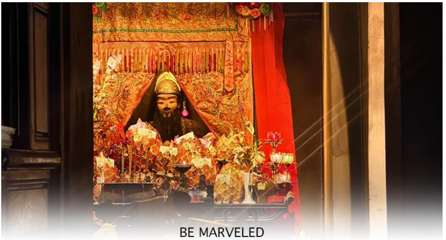
BE MARVELED วัดแซง อนุรักษ์ 600 ปี

ถึง 600 ปี แล้วยังเป็นเพราะเป็นวัดแซงดั้งเดิม เป็นวัดแซงแห่งแรกที่สร้างขึ้นเพื่อบูชาเทพเจ้าแซง ซึ่งคือแม่ทัพแซงวีรบุรุษผู้กล้าหาญและซื่อสัตย์จากสมัยราชวงศ์ซ่งใต้ (ค.ศ. 1127-1279) ซึ่งได้รับการยกย่องจากฮ่องเต้จากวีรกรรมในการปราบกบฏทางตอนใต้ของจีน สาเหตุที่วัดแซงถูกสร้างขึ้นที่นี่ เพราะมีตำนานเล่าว่า ท่านแม่ทัพแซงได้ให้การคุ้มครองจักรพรรดิเจ้าปิง องค์จักรพรรดิองค์สุดท้ายของราชวงศ์ซ่งใต้ ระหว่างการเสด็จหนีลงใต้มาตั้งหลักแหล่งที่นี่ก่อนราชวงศ์จะล่มสลาย ด้วยความซื่อสัตย์และความกล้าหาญเป็นที่ประจักษ์ ชาวบ้านจึงเริ่มบูชาแม่ทัพแซงหลังจากท่านเสียชีวิตลง