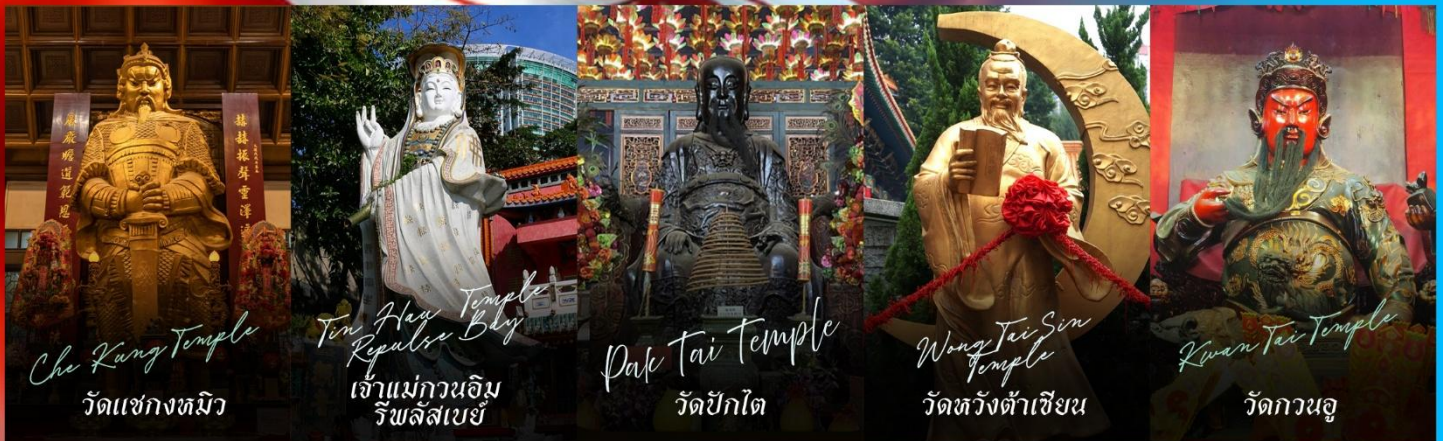
Che Kung Temple วัดแซงกตมัว

รายการทัวร์ข้างต้นอาจมีการปรับเปลี่ยนเพื่อความเหมาะสม