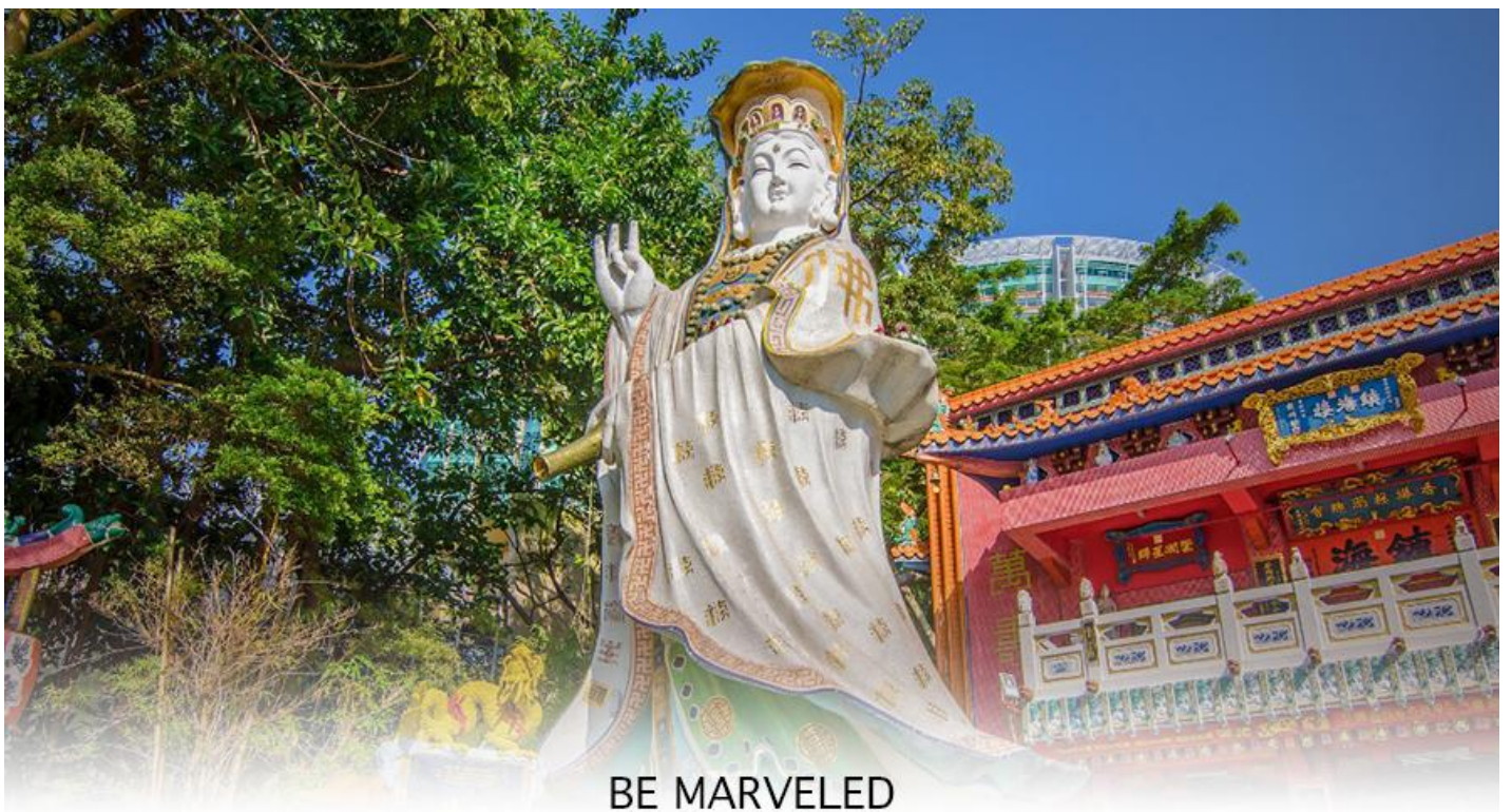
BE MARVELED วัดเจ้าแม่กวนอิมริพัลส์เบย์

การเงิน และขอพรขอ โชคลาภเพื่อเป็นสิริมงคลและขอพร เจ้าแม่ทับทิม หรือ เทพธิดาแห่งท้องทะเล ซึ่งทำหน้าที่ปกป้องกันคุ้มครองชาวประมง ตั้งโดดเด่นอยู่ท่ามกลางสวนสวยที่ทอดยาวลงสู่ชายหาดให้ท่านนมัสการขอ และนำท่านเดินข้าม สะพานต่ออายุ ซึ่งเชื่อกันว่าข้ามหนึ่งครั้งจะมีอายุเพิ่มขึ้น 3 ถ้าข้ามแล้วห้ามเดินย้อนกลับไปเด็ดขาด เพราะคนฮ่องกงเชื่อว่าชีวิตจะสั้นลงไป 3 ปี สำหรับคนโตจะนิยมขอพรกับ เทพเจ้าแห่งความรัก ให้เอามือลูบที่บริเวณหินสีดำ พร้อมกับอธิษฐานให้สมหวังกับความรัก ปิดท้ายด้วยการรับพลังดวงจี้จาก ศาลา แปดทิส ซึ่งถือเป็นจุดรวมรับพลัง ถือเป็นจุดที่มีดวงจี้ดีที่สุดของเกาะฮ่องกง และยังมีรูปปั้นองค์เทพอีกมากมายภายในวัดแห่งนี้ ให้กราบไหว้ขอพร