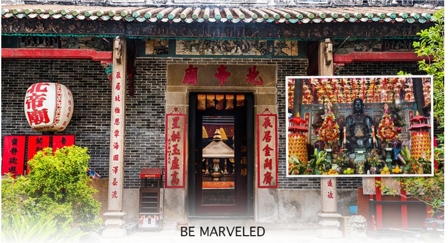
BE MARVELED วัดปักไต้

คนที่เป็นศัตรูของ เราเปลี่ยนใจมาเป็นมิตร เป็นที่นิยมอย่างมากของชาวท้องถิ่นฮ่องกงมาราบไหว้ขอพรกันที่วัด