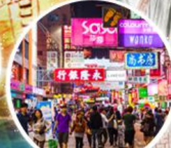
Shopping Taim Sha Tsui