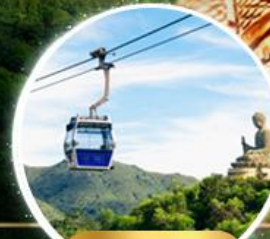
รวมกระเช้านองปีง