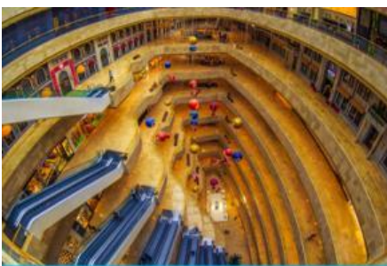
จัตุรัสเต๋อจี

พักที่ โรงแรม Holiday Inn Express Dongshan Hotel 4* หรือเทียบเท่าในนครหนานจิง