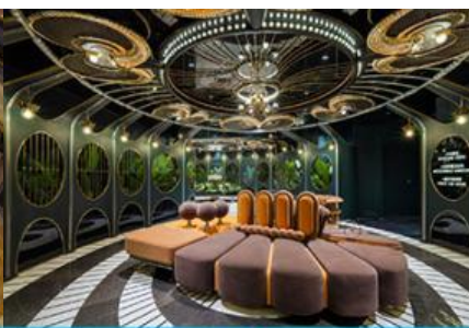
ห้องน้ำไอเทค