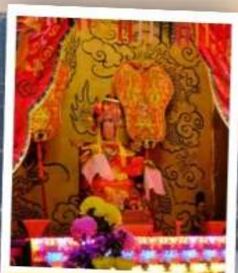
เจ้าแม่ทับทิม จอสเฮ้าส์เบย์