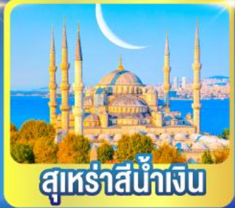
สุเหร่าสีน้ำเงิน