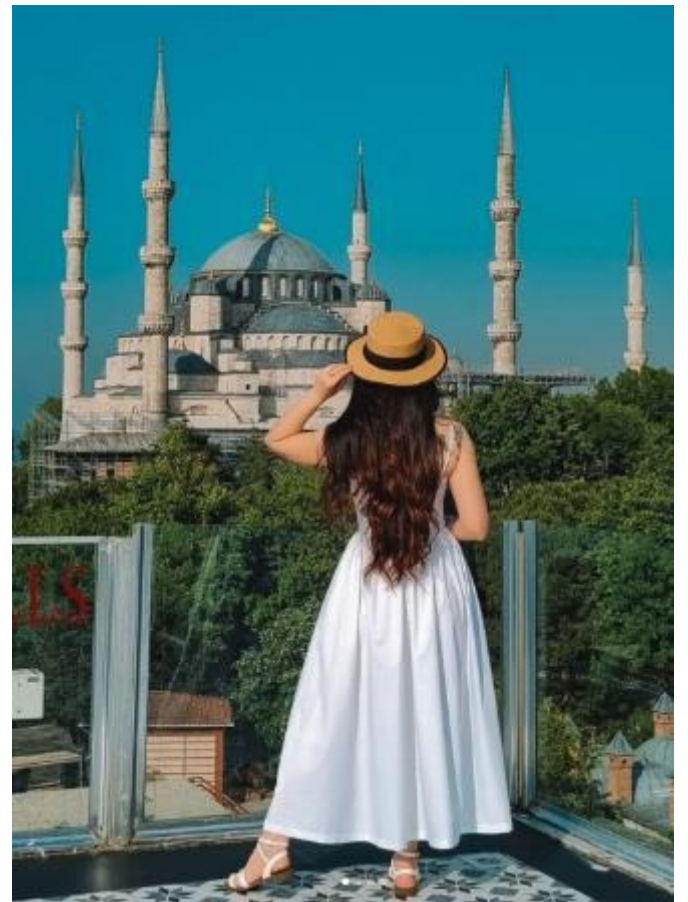
สมควรแก่เวลา นำท่านเดินทางสู่สนามบินอิสตันบูล