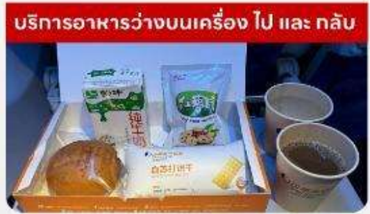
บริการอาหารว่างบนเครื่อง ไป และ กลับ