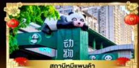
สถานีหมีแพนด้า