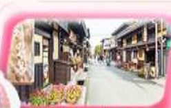
ทาคายามา