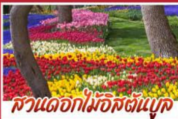
สวนดอกไม้อักษัตันบูค