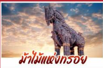
ม้าไม้แห่งกรอย