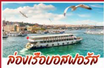
ล่องเรือบอสฟอรัส