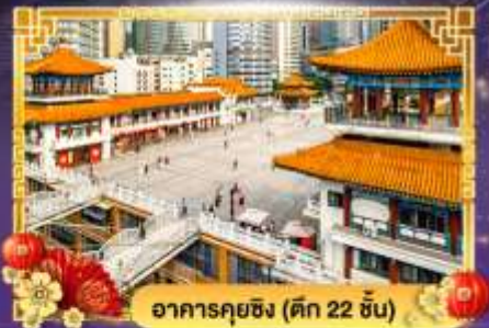
อาคารคุยซิง (ตึก 22 ชั้น)