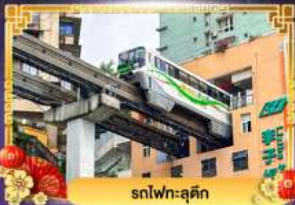
รถไฟฟ้าฉงชิ่ง