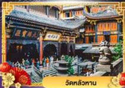
วัดหลิวทาน