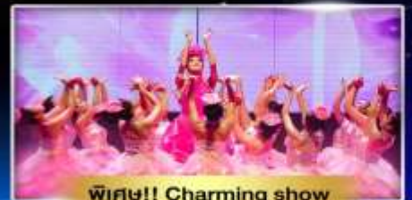
พิเศษ!! Charming show