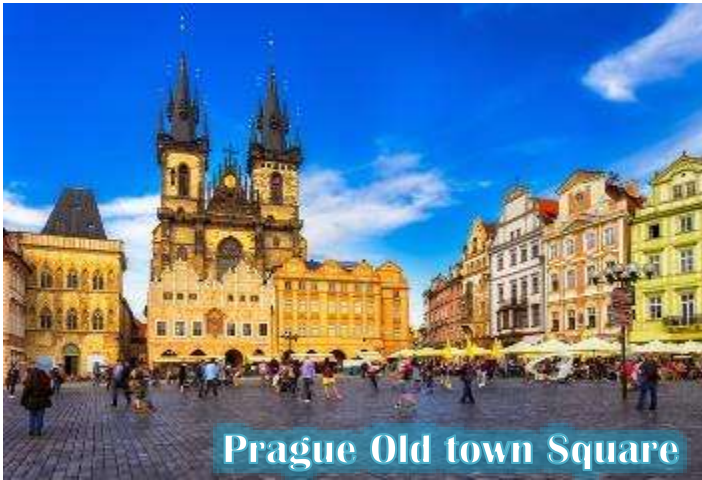
Prague Old town Square