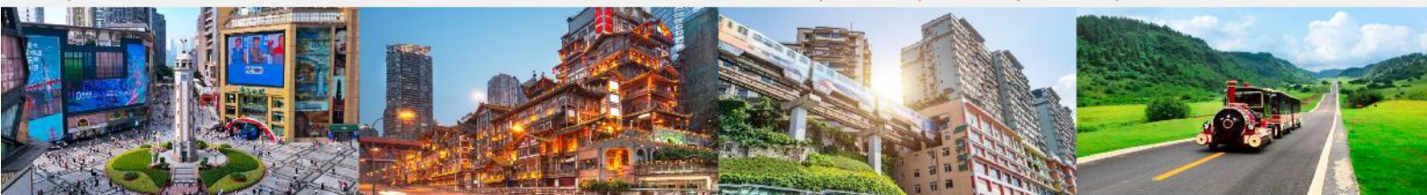
ถนนเจี๋ยฟางเป่ย์