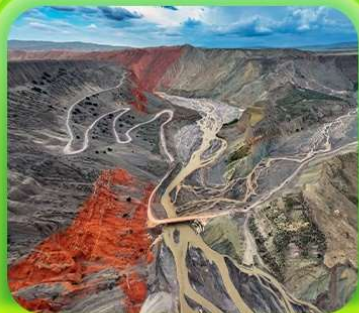
"แกรนด์แคนยอนคู่ชานโจว"

ซินเจียงเหนือ ทะเลสาบไซลี่มู "น้ำตาหยดสุดท้ายของแอตแลนติก" • ทุ่งหญ้านาราตี ทุ่งดอกไม้เทียนซาน • ผ่านชมสะพานกั๋วจื่อโกว • ถนนหลิวซิงเจียง • ตลาดต้าปาจา