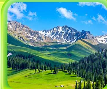
"ทุ่งหญ้านาราตี"