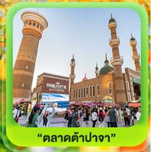
"ตลาดต้าปาจา"

รวมรถไฟความเร็วสูง 1 ขบวน (อ๋หมิง - อูรูมูฉี)