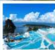
ซานโตรินี่ต้าหลี่

“เกาะเสี่ยวผู่...เกาะลึกลับกลางทะเลสาบ เอ้อไห้”