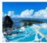
ซานโตรีนต้าหลี่