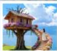
หมู่บ้านเหวินเป่

เมืองโบราณต้าหลี่ / นั่งเรือสู่เกาะเสี่ยวผู่ / ซานโตรินี่ (รวมรถแท็กซี่) / ถนนชางเอ๋อส์ต้าต้า / กุซาอวิ้นเซียงซาน / ท่าอากาศยานหล่งกั้น โถ่ง $ ทะเลสาบเอ้อไห้ / หมู่บ้านโบราณสี่จิว / หมู่บ้านเหวินเป่ / สวนดอกไม้ตามฤดูกาล