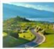
ภูเขาอวี่นเซียงชาน