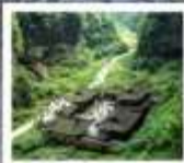
หุบเขาหิมะเขานควอสรค์