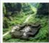
หุบเขาไฟสพานสวรรค์