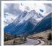
อุทยานภูเขาซีดรุณี

เฉิงตู • ฉงชิ่ง • อุ๋หลง • ซีดรุณี • ต่ากู่ปิงชว่น