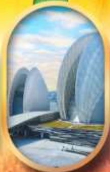
โรสละครโขงนุก