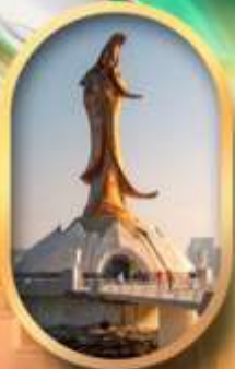
เจ้าแม่ทวนอิมริมทะเล