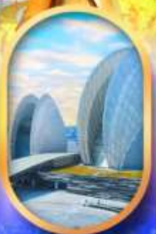
โรงละครไข่มุก