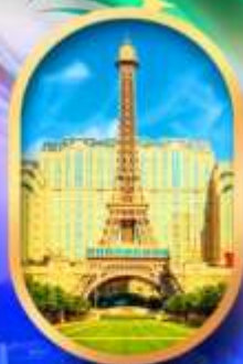
เดอะปารีสเซียน