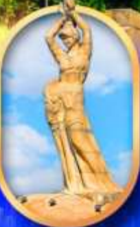
เด็กหญิงชาวประมง