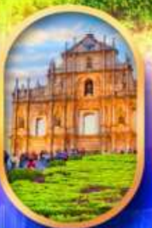
โบสถ์เซนต์พอล