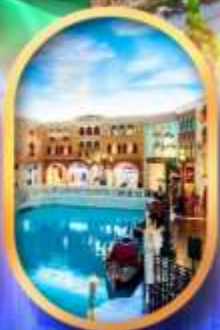
เดอะเวนิเซียน