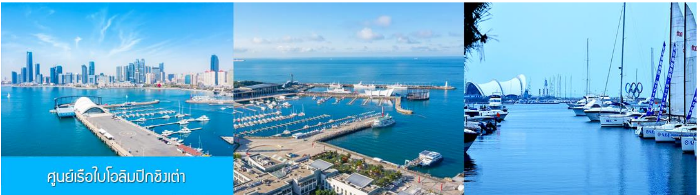
ศูนย์เรือใบโอลิมปิกชิงเต่า

จากนั้นนำท่านเที่ยวชม โรงเบียร์ชิงเต่า 青岛啤酒博物馆 พิพิธภัณฑ์เบียร์ที่ขึ้นชื่อของเมืองชิงเต่า ซึ่งเป็นเบียร์ยี่ห้อแรกที่ผลิตขึ้นในประเทศจีน ชมเบียร์ คอลเลกชันที่มียี่ห้อหลากหลายที่สุดของโลก และชมการจัดแสดงภาพและวีดิทัศน์เกี่ยวกับวิวัฒนาการของเบียร์ ขั้นตอนการผลิตและอื่น ๆ ที่เกี่ยวข้อง พร้อมชิมเบียร์ชิงเต่า ซึ่งเป็นเบียร์ที่ขายดีที่สุดยี่ห้อหนึ่งของจีน.. (ชิมเบียร์ชิงเต่าท่านละ 1 แก้ว รับกลับอีก 1 ขวดเล็ก ตอนเดินออก)