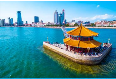
สะพานเกี้ยวเบียว