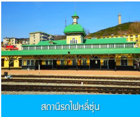
สถานีรถไฟหลี่ซุ่น