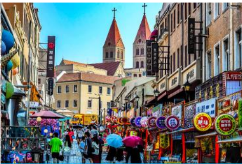
ถนนางซาน

หลังอาหารนำท่านเดินทางชม สะพานจ้านเถียว 栈桥 เป็นแลนด์มาร์กแห่งประวัติศาสตร์คู่เมืองชิงเต่า สร้างเมื่อปี ค.ศ.1891 มีลักษณะเป็นสะพานหินทอดยาวกว่า 440 เมตรสู่ทะเล ปลายสะพานมีศาลา ทรงแปดเหลี่ยมสีแดงที่โดดเด่น ซึ่งเป็นสัญลักษณ์บนฉลากเบียร์ชิงเต่า ขึ้นชื่อเรื่องวิวสวย รับลมทะเล ให้ท่านเก็บภาพบรรยากาศ