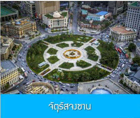
จัตุรัสวงเวียน