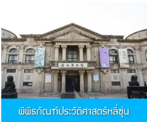
พิพิธภัณฑ์ประวัติศาสตร์หลี่ซุ่น

นำท่านเที่ยวชมและเก็บภาพ ณ สถานีรถไฟหลี่ซุ่น 旅顺火车站 เป็นสถานีปลายทางของเส้นทางรถไฟสาขาเส้นหยาง - ต้าเหลียน สร้างขึ้นในปีค.ศ. 1903 ออกแบบโดยสถาปนิกชาวรัสเซีย เป็นอาคารอิฐก่อปูนผสมโครงสร้างไม้ตามสถาปัตยกรรมรัสเซีย.