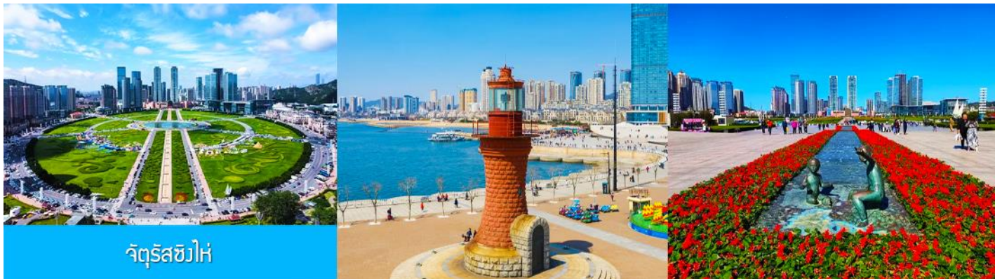
จัตุรัสชิงไห่

นำท่านเที่ยวชม จัตุรัสชิงไห่ 星海广场 เป็นจัตุรัสขนาดใหญ่เป็นแลนด์มาร์คสำคัญของเมืองต้าเหลียน สร้างขึ้นเพื่อเฉลิมฉลองในโอกาสที่รัฐบาลอังกฤษคืนเกาะฮ่องกงในให้จีนในปี ค.ศ. 1997 ตั้งอยู่ชายฝั่งทะเลในเมืองต้าเหลียน เป็นจัตุรัสใจกลางเมืองที่ใหญ่ที่สุดในโลกและเป็นแลนด์มาร์คของเมืองต้าเหลียน รายล้อมด้วยตึกกระจกฟ้าที่ทันสมัย ภายในมีบ่อน้ำพุดนตรี ลานหญ้าขนาดใหญ่ และลานกว้างสำหรับจัดกิจกรรมกลางแจ้ง อาทิ เทศกาลเบียร์นานาชาติ การแข่งขันวิ่งมาราธอน งานแฟชั่นนานาชาติเมืองต้าเหลียน ฯลฯ