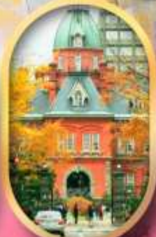
ศาลาว่าการเก่า