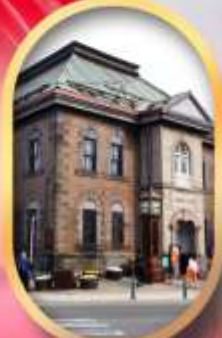
พิพิธภัณฑ์กล่องดนตรี