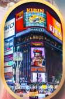
ช้อปปิ้งย่านซูซุกิโนะ