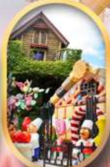
โรงงานช็อกโกแลต