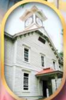
ผ่านชมหอนาฬิกา