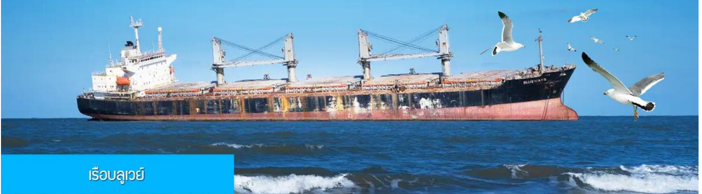
เรือบลูเวย์

รับประทานอาหารเช้า ณ ห้องอาหารของโรงแรม (7)