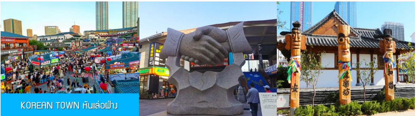
KOREAN TOWN หันเล่อฝาง