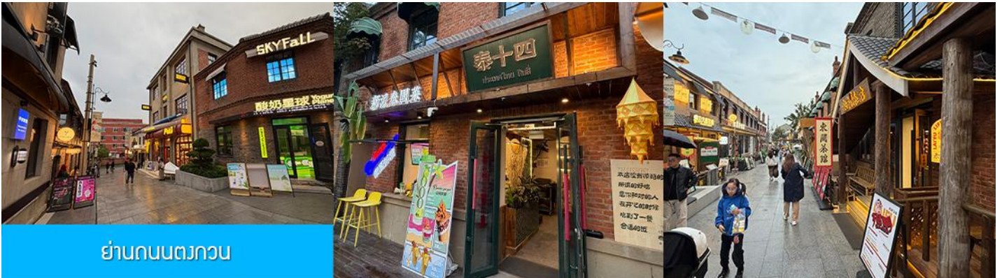
ย่านถนนตวงกวน

หลังอาหารนำท่านเที่ยวชม จัตุรัสชิงไห่ 星海广场 เป็นจัตุรัสขนาดใหญ่เป็นแลนด์มาร์คสำคัญของเมืองต้าเหลียน สร้างขึ้นเพื่อเฉลิมฉลองในโอกาสที่รัฐบาลอังกฤษคืนเกาะฮ่องกงโนให้จีนในปี ค.ศ. 1997 ตั้งอยู่ชายฝั่งทะเลในเมืองต้าเหลียน เป็นจัตุรัสใจกลางเมืองที่ใหญ่ที่สุดในโลกและ เป็นแลนด์มาร์คของเมืองต้าเหลียน รายล้อมด้วยตึกระฟ้าที่ทันสมัย ภายในมีบ่อน้ำพุดนตรี ลานหญ้าขนาดใหญ่ และลานกว้างสำหรับจัดกิจกรรมกลางแจ้ง อาทิ เทศกาลเบียร์นานาชาติ การแข่งขันวิ่งมาราธอน งานแฟชั่นนานาชาติเมืองต้าเหลียน ฯลฯ