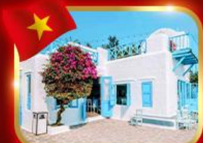
คาเฟ่สุดชิค ซานทรา มารีน่า