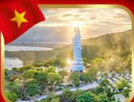
หอพระกวนอิม วัดหลั่นอึ้ง