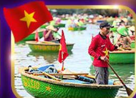
เรือกระด้ง หมู่บ้านกิมทาน