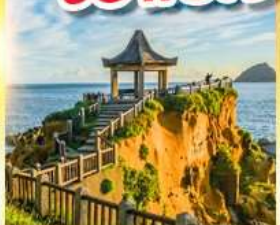
เกาะเหอผิง

พักย่านซีเหมินติง 2 คืน ขอพรเจ้าแม่กวนอิมพันมือ