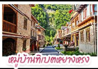
เด็มบ้านทิเบตเซียงเซรง

ตะลุยเจ็ดคู หิมะต้ากู่ปิงชวณ ชวนเช็คอินแพนด้าอิ๊กซ์ พักใจที่หยดน้ำดาสีฟ้า! แวะชิลเมืองโบราณลั่วไต้ สัมผัสสมมติเสน่ห์ หมู่บ้านทิเบตของทรงฮาต้อ สัมผัสความหนาวเย็นที่ อุกยานสวรรค์ธารน้ำแข็งต้ากู่ปิงชวณ แหล่งรวมวิวหลักล้าน ตื่นตากับแสงสียามค่ำคิน หยดน้ำดาสีฟ้า ณ สะพานหนามเอียว เมืองตุ๋นเจียงเจียงนั ก่อนปิดท้ายด้วยการช้อปปิ้งจุใจ ถนนชุนซู่-ไถ่กู่หลี่ และอะภาทกั๊น แพนด้าเชลฟี่ สุดคิว