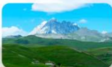
ทุ่งหญ้าด่าง