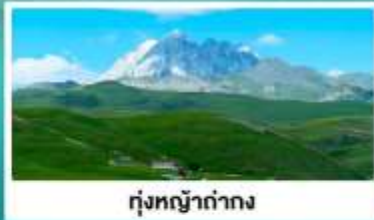
ทุ่งหญ้างด่าง