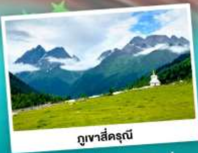
ภูเขาสีครุณี

ชมความสวยงามทุ่งหญ้าด่าง เทือกภูเขาสีครุณี อุทยานยาดิง "แซงกรีทว่าแห่งสุดท้าย" S-คืบ 5A