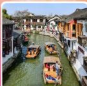
หมู่บ้านโบราณซูเจียเจี๋ย