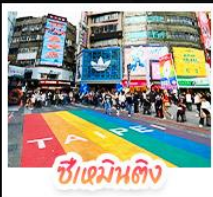
ซีเหมินตง