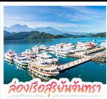
ล่องเรือสุริยจันทร์

ล่องเรือชมทะเลสาบสุริยจันทร์ (SUN MOON LAKE) ชมทะเลสาบ หวะ-วัดสวนทอง • อิสระเดินเล่น หมู่บ้านอู่คำชา • นั่งรถไฟเล็กโบราณ (1 สกามี) สัมผัสบรรยากาศเส้นทางรถไฟสายธรรมชาติ • ตะลุย ไทจงไม้ไผ่บาร์เกิด แหล่งรวมแฟชั่นและสตรีทฟู้ด • ช้อปปิ้งย่าน ซิเหมินตง (XIMENDING) ถ่ายรูปแลนด์มาร์ค ดึกไทเป 101 • ช้อปปิ้งถึงทวงที่ MITSUI OUTLET PARK ชมความสวยงามของ อนุสรณ์สถานเจียงไคเช็ค • ขอพรความรักที่ วัดหลงชาน ชมโศกหิมะที่สวยงามที่ เย่หลิว • ชมบรรยากาศเมืองเก่าที่ จิวเฟิน