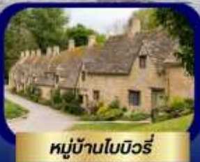
หมู่บ้านไบบิวรี่