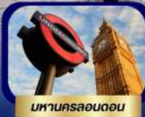
มหานครลอนดอน