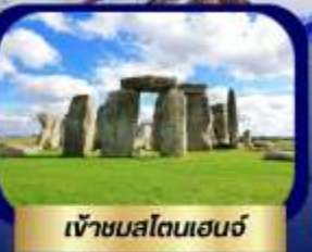
เข้าชมสโตนเฮนจ์