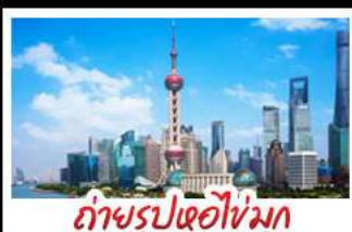
ถ่ายรูปไข่มุก