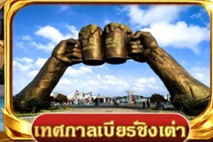
เทศกาลเบียร์ชิงเต่า