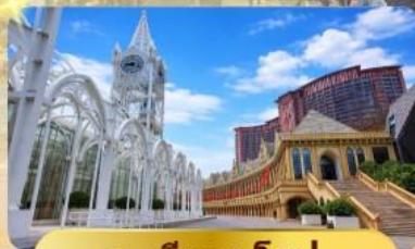
ระเบียงยุโรป