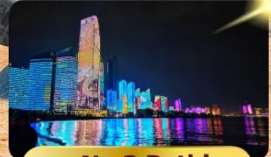
หาด No.3 Bathing

เมนูพิเศษ ซาบูสายพาน 6 วัน 4 คืน เดินทาง : พฤษภาคม 69