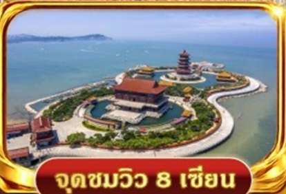
จุดชมวิว 8 เซียน