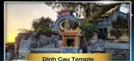
Dinh Cau Temple