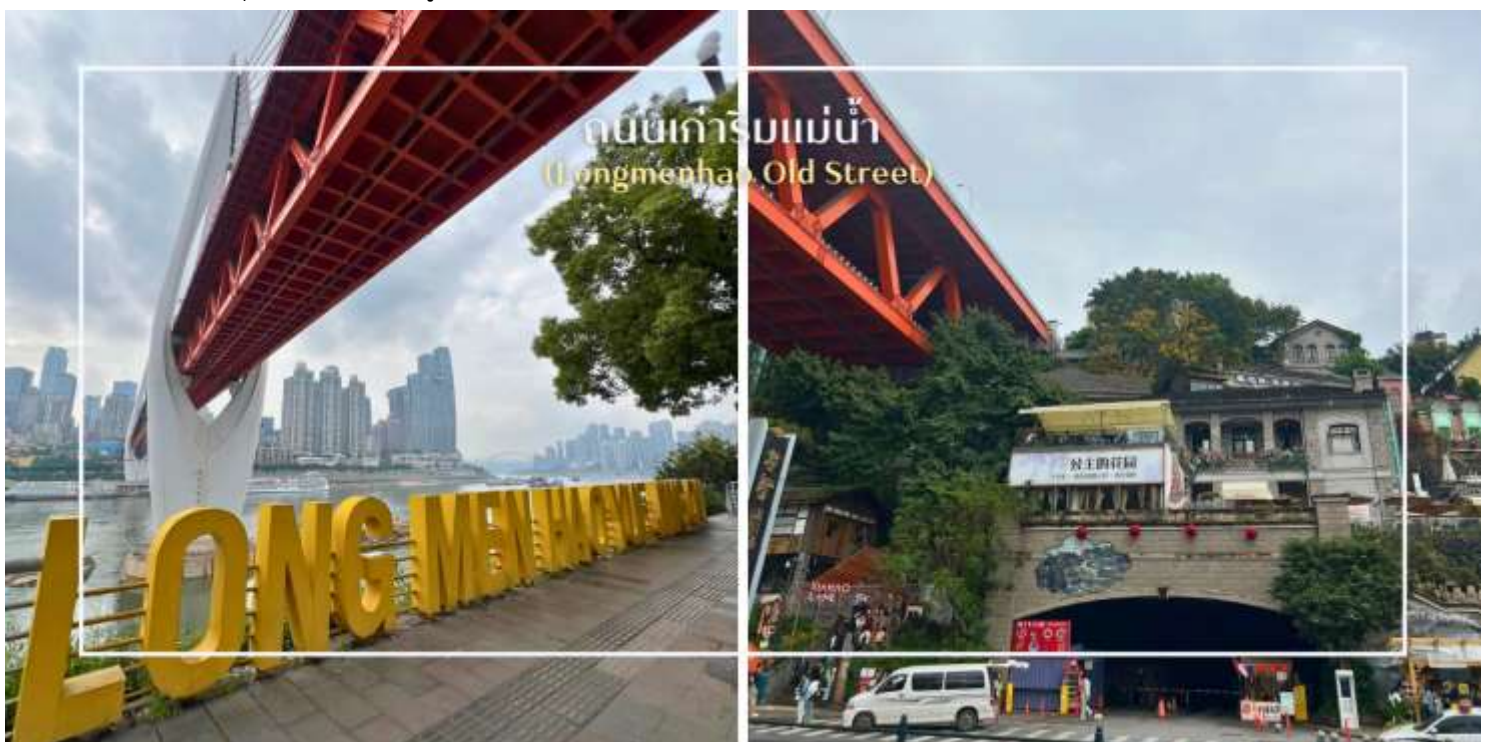
ถนนเก่าริมแม่น้ำ (Longmenhao Old Street)

นำท่านสู่ ถนนโบราณหลงเหมินฮ่าว (Longmenhao Old Street) ถนนเก่าริมแม่น้ำอีกหนึ่งแลนด์มาร์กสำคัญของเมืองฉงชิ่ง ถนนสายนี้เคยเป็นย่านการค้าและศูนย์กลางเศรษฐกิจที่รุ่งเรืองในยุคราชวงศ์หมิงและชิง ปัจจุบันได้รับการอนุรักษ์ไว้อย่างดี เพื่อเป็นแหล่งเรียนรู้ทางประวัติศาสตร์ และแหล่งท่องเที่ยวเชิงวัฒนธรรมที่เต็มไปด้วยเสน่ห์บรรยากาศของถนนยังคงอบอวลไปด้วยกลิ่นอายวันวาน อาคารบ้านเรือนแบบโบราณผสมผสานกับร้านค้า ร้านอาหาร และแกลเลอรีร่วมสมัยอย่างลงตัว อีกทั้งยังเป็นจุดชมวิวแม่น้ำที่โดดเด่น สามารถมองเห็นสะพานข้ามแม่น้ำแยงซีและทัศนียภาพของเมืองฉงชิ่งในมุมที่สวยงาม และอีกหนึ่งจุดหมายที่สะท้อนเสน่ห์ดั้งเดิมของที่นี่คือ Xiahaoli Old Street ตรอกซอกซอยแคบ ๆ บันไดหิน และสถาปัตยกรรมไม้โบราณที่ยังคงกลิ่นอายของวิถีชีวิตในอดีต แม้ในปัจจุบันจะได้รับการบูรณะและพัฒนาให้เหมาะกับการท่องเที่ยว ก็ยังคงรักษาบรรยากาศคลาสสิกเอาไว้ได้อย่างดี