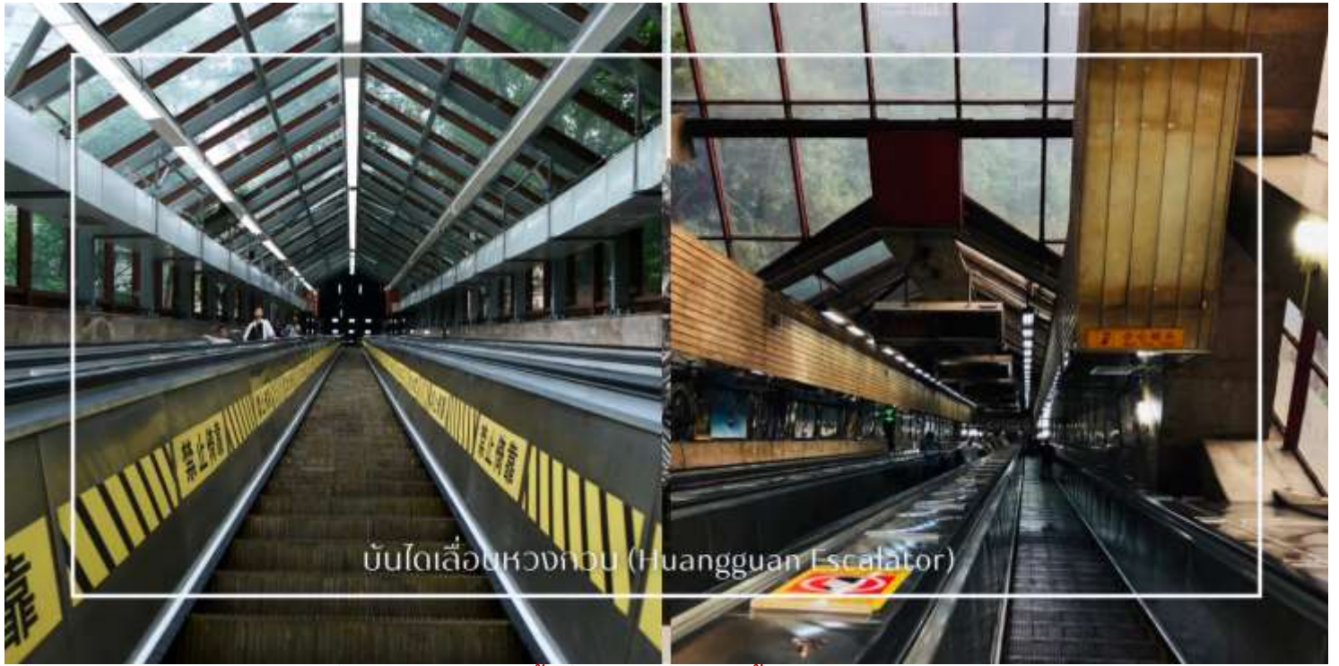
บันไดเลื่อนหวงกวน (Huangguan Escalator)