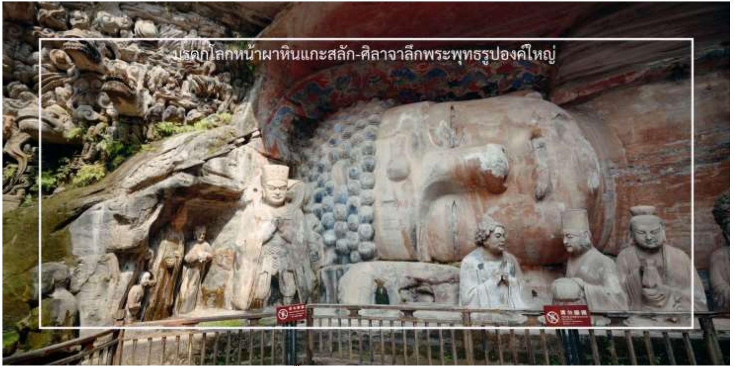
บรรดากล่องหน้าผาหินแกะสลัก-ศิลาจากลึงพระพุทธรูปองค์ใหญ่