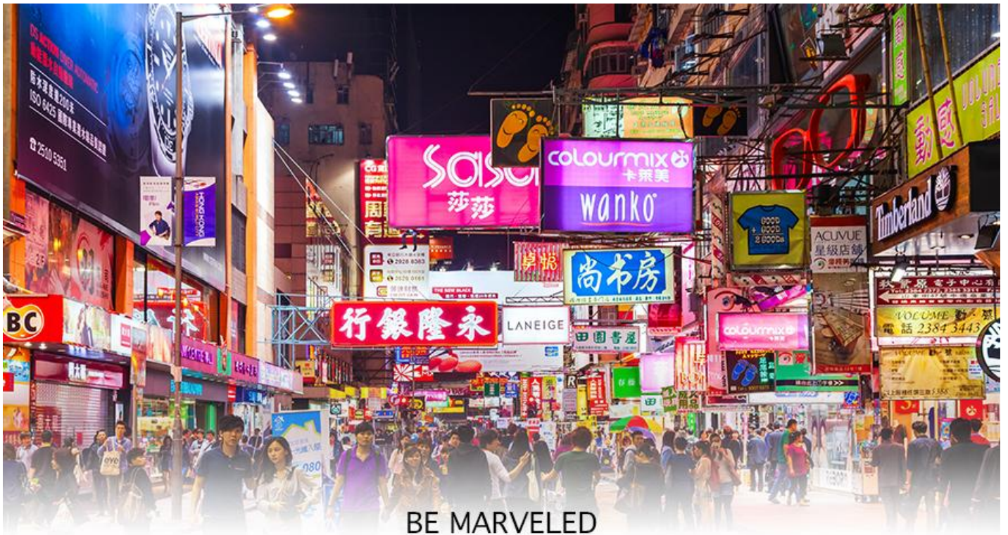
BE MARVELED TSIM SHA TSUI

📍 อีตระอาหารอาหารเย็นตามอัชชาติ **เพื่อความสะดวกในการช้อปปิ้ง**