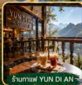
ร้านกาแฟ YUN DI AN