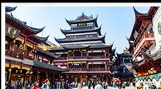
ตลาดร้อยปีเฉิงหวงเหมย