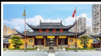
วัดพระหยก