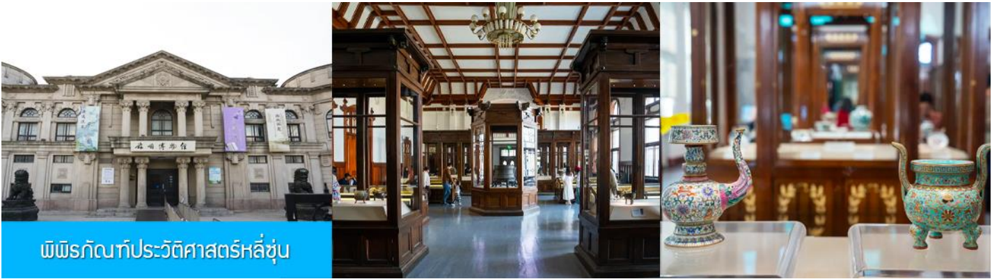
พิพิธภัณฑ์ประวัติศาสตร์หลี่ซุ่น

จากนั้นนำท่านเที่ยวชมและเก็บภาพ ณ พิพิธภัณฑ์ประวัติศาสตร์หลี่ซุ่น 旅顺博物馆 เป็นอาคารพิพิธภัณฑ์เก่าแก่อายุกว่าร้อยปีแห่งแรกที่สร้างขึ้นทางภาคตะวันออกเฉียงเหนือของจีน อาคารพิพิธภัณฑ์มีความโดดเด่นด้วยสถาปัตยกรรมแบบกรีกโรมันยุคเรเนซองส์ ผสมผสานสถาปัตยกรรมแบบตะวันตก ภายนอกมีการจัดแสดงโบราณวัตถุกว่า 60,000 ชิ้น ท่านสามารถเก็บภาพที่ระลึกด้านหน้าอาคารพิพิธภัณฑ์ และสามารถเข้าชมโบราณวัตถุภายในพิพิธภัณฑ์ได้ตามอัธยาศัย (พิพิธภัณฑ์ปิดทุกวันจันทร์)..