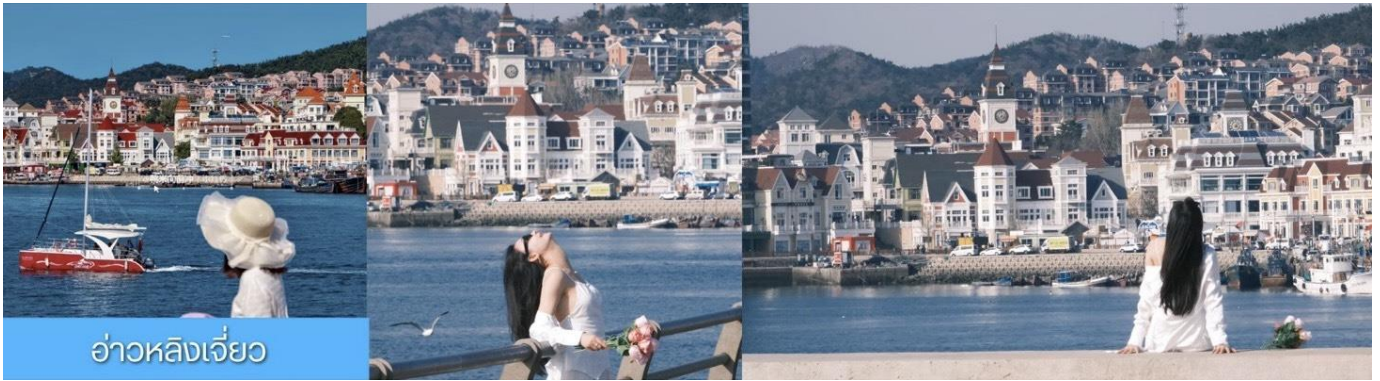
อ่าวหลิงเจี้ยว

จากนั้นนำท่านเที่ยวชม อ่าวหลิงเจี้ยว 菱角湾 เป็นอ่าวธรรมชาติและแลนด์มาร์กถ่ายรูปสุดฮิตในเมืองต้าเหลียน ประเทศจีน โดดเด่นด้วยวิวทัศนียภาพบ้านเรือนสีสดใสเรียงรายริมน้ำ จนได้รับฉายาว่า "Little Santorini แห่งต้าเหลียน" และเป็นจุดชมพระอาทิตย์ตกที่สวยงามมากแห่ง