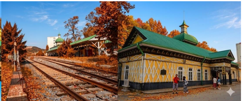
สถานีรถไฟหลี่ซุ่น

นำท่านเที่ยวชมและเก็บภาพ ณ สถานีรถไฟหลี่ซุ่น 旅顺火车站 เป็นสถานีปลายทางของเส้นทางรถไฟสาขา เส้นหยาง - ต้าเหลียน สร้างขึ้นในปีค.ศ. 1903 ออกแบบโดยสถาปนิกชาวรัสเซีย เป็นอาคารอิฐก่อปูนผสม โครงสร้างไม้ตามสถาปัตยกรรมรัสเซีย.