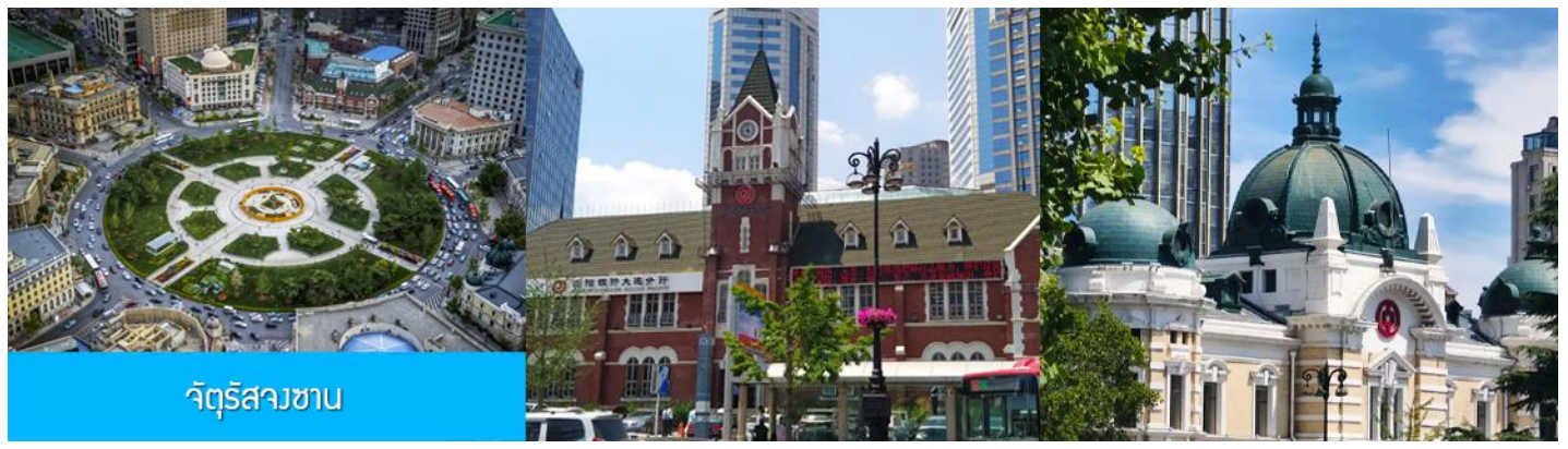
จัตุรัสวงเวียน

จากนั้นนำท่านเที่ยวชม อ่าวหลิงเจี้ยว 菱角湾 เป็นอ่าวธรรมชาติและแลนด์มาร์กถ่ายรูปสุดฮิตในเมืองต้าเหลียน ประเทศจีน โดดเด่นด้วยวิวทัศนียภาพบ้านเรือนสีสดใสเรียงรายริมน้ำ จนได้รับฉายาว่า "Little Santorini แห่งต้าเหลียน" และเป็นจุดชมพระอาทิตย์ตกที่สวยงามมากแห่ง