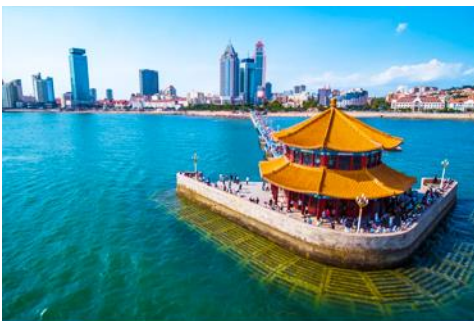
สะพานเจียวเจียว

หลังอาหารนำท่านสัมผัสสมนต์เสน่ห์ของหมู่บ้านชาวประมง ซาจื่อโจ่ว 沙子口渔村 ให้ท่านได้ชมวิถีชีวิต ดั้งเดิมกับทิวทัศน์ชายทะเล วิิวบ้านเรือนหลากสีที่ตั้งเรียงรายตามแนวชายฝั่งที่โดดเด่นด้วยเอกลักษณ์ ทำให้ หมู่บ้านซาจื่อโจ่ว เป็นเอกลักษณ์เป็นจุดถ่ายภาพราวกับเมืองชายฝั่งของอิตาลีในยุโรป, จึงเป็นที่ดึงดูดให้ นักท่องเที่ยวต่างอยากมาสัมผัสบรรยากาศ ณ หมู่บ้านชาวประมงซาจื่อโจ่วแห่งนี้