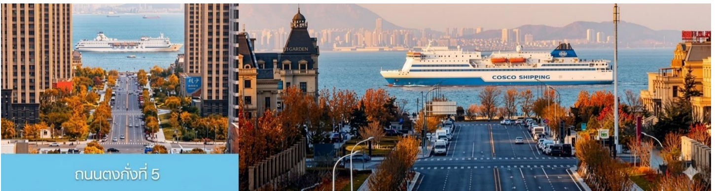
ถนนตงกั้งที่ 5

จากนั้นนำท่านเที่ยวชม สวนน้ำเมืองเวนิสตะวันออก 大连东方威尼斯城 เป็นเมืองเวนิสจำลองที่ถูกสร้างขึ้นด้วยทุนกว่า 8,000 ล้านบาท ออกแบบโดยบริษัท ARC จากประเทศฝรั่งเศส โดยจำลองผังเมืองเวนิสในประเทศอิตาลี บนพื้นที่กว่า 400,000 ตารางเมตร ประกอบด้วยคลองเวนิสและอาคารที่มีสถาปัตยกรรมแบบตะวันตกกว่า 200 หลัง มีบริการล่องเรือคอนโดล่าแก่นักท่องเที่ยว นำท่านเดินชม ถ่ายภาพที่ระลึกท่ามกลางอาคารสไตล์ยุโรป ตามอัธยาศัย.