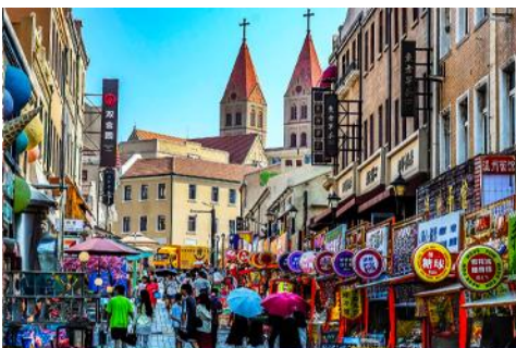
ถนนจงซาน

นำท่านเดินทางชม สะพานจ้านเจียว 栈桥 เป็นแลนด์มาร์คแห่งประวัติศาสตร์คู่เมืองชิงเต่า สร้างเมื่อปี ค.ศ.1891 มีลักษณะเป็นสะพานหินทอดยาวกว่า 440 เมตรสู่ทะเล ปลายสะพานมีศาลา ทรงแปดเหลี่ยมสีแดงที่โดดเด่น ซึ่ง เป็นสัญลักษณ์บนฉลากเบียร์ชิงเต่า ขึ้นชื่อเรื่องวิวสวย รับลมทะเล ให้ท่านเก็บภาพบรรยากาศ