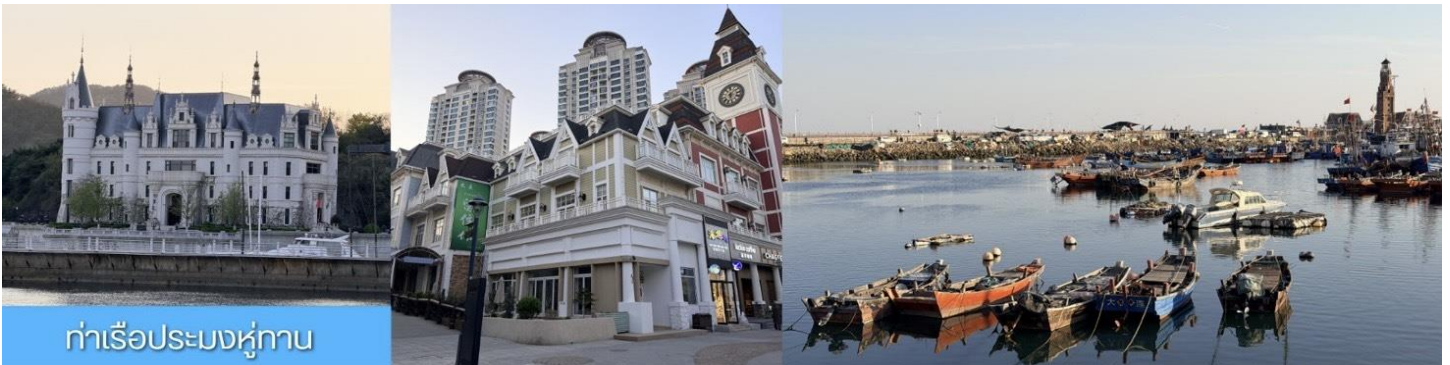
ท่าเรือประมงหู่กาน

พักที่ DALIAN JUZISHUIJING HOTEL หรือ โรงแรมระดับ 4 ดาวท้องถิ่น เมืองต้าเหลียน