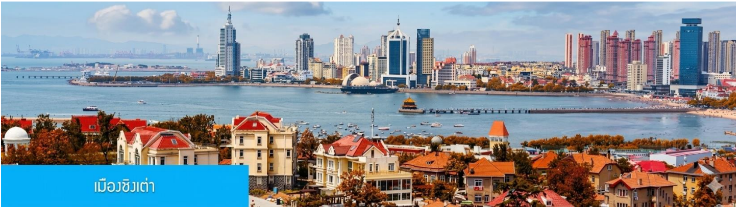
เมืองชิงเต่า