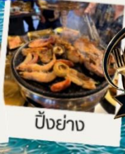
บั้งย่าง