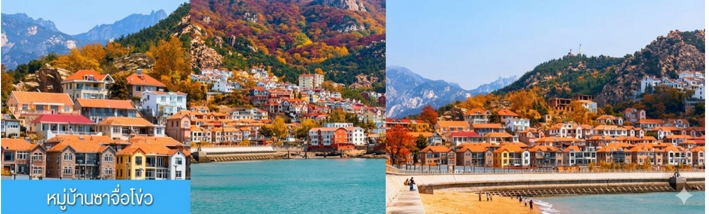
หมู่บ้านชาวโจว