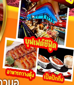
บุฟเฟต์ซีฟู้ด