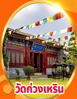
วัดกวางเหรีน