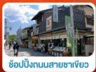
ซ้อปิ้งถนนสายชาเขียว