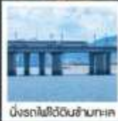
นั่งรถไฟใต้ดินข้ามทะเล