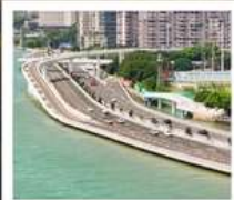
สะพานเหยียนหวู่เฉียว