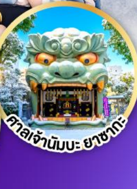
ศาลเจ้ามังกร: ยาชากะ