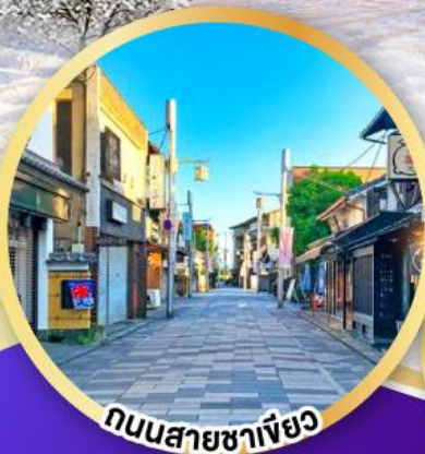
ถนนสายชาเขียว