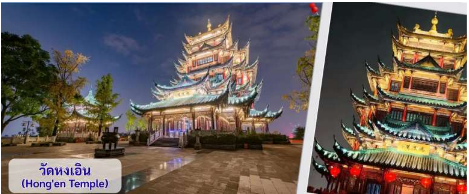
วัดหงเอิน (Hong'en Temple)

จากนั้นนำทุกท่านชม วัดหงเอิน หรือมักเรียกกันว่า วัดหงเอิน หรือ สวนสาธารณะวัดหง เป็นหนึ่งในแลนด์มาร์กท่องเที่ยวที่สวยงามและได้รับความนิยมอย่างมาก ตั้งอยู่ในเขตเจียงเป่ย์ เมืองฉงชิ่ง จุดเด่นและไฮไลท์สำคัญของที่นี่คือ ศาลาหรือเจดีย์หงเอิน สูง 7 ชั้นที่ตั้งอยู่บนยอดเขาหลงจี (สูงประมาณ 468 เมตรเหนือระดับน้ำทะเล) สถาปัตยกรรมเป็นสไตล์จีนโบราณดั้งเดิม หลังคามีลวดลายมังกรอย่างประณีต ตัวศาลาล้อมรอบด้วยตึกสูงระฟ้าของเมืองฉงชิ่ง ให้ความรู้สึกเหมือน "วัดโบราณที่ซ่อนตัวอยู่ในมหานครไซเบอร์พังก์" ไฮไลท์ที่ห้ามพลาดเด็ดขาดคือ การชมวิวยามค่ำคืน เมื่อถึงเวลาเปิดไฟ (ประมาณ 18:30 - 19:30 น. เป็นต้นไป ขึ้นอยู่กับฤดูกาล) ตัวศาลาจะส่องแสงทองอร่ามตัดกับความมืดและแสงไฟของตึกระฟ้าโดยรอบ นักท่องเที่ยวนิยมใส่ชุดฮั่นฝู (Hanfu) มาเดินถ่ายรูปตามบันไดและระเบียงทางเดิน ซึ่งให้บรรยากาศคล้ายหลุดเข้าไปในอนิเมะเรื่อง Spirited Away และยังเป็นจุดชมวิวยามโรมาที่สามารถมองเห็นแม่น้ำเจียงหลิง รวมถึงเขตหยูจางและเจียงเป่ย์ได้แบบ 360 องศา