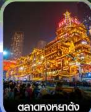
ตลาดหงหยาดิ่ง