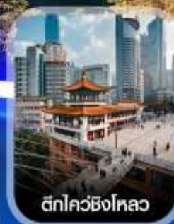
ตึกไคว่ซิงไหลว

✈️ คอนเฟิร์มออกเดินทาง ทุกพีเรียด 2 ท่านขึ้นไป