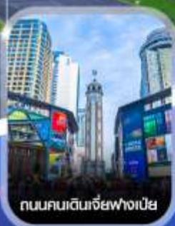
ถนนคนเดินเจี๋ยฟ่างเป็ย