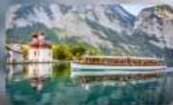
ทะเลสาบโคนิกซ์