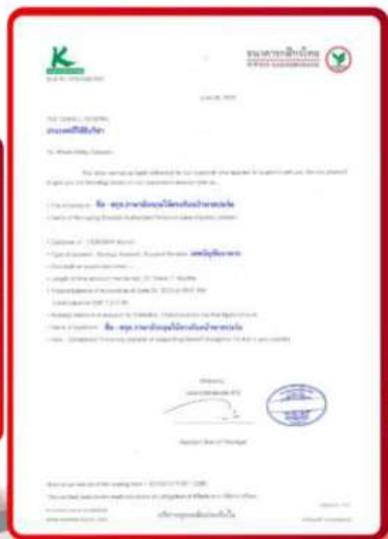
ตัวอย่าง Bank Guarantee ที่ผู้สมัครต้องเตรียมมา