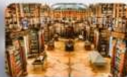
หอสมุดมรดกโลก St.Gallen