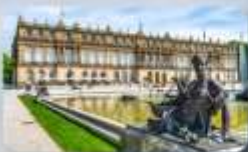
พระราชวัง Herrenchiemsee